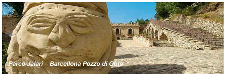
Parco Jalari – Barcellona Pozzo di Gotò