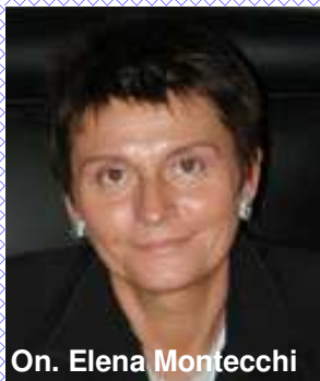
On. Elena Montecchi

Dopo aver appreso all'AGIS, il 5 Dicembre scorso, il contenuto del nuovo regolamento per le assegnazioni alla prosa che il Ministero sta per emanare, la FNAS ha espresso le proprie perplessità sull'inserimento delle attività dell'arte di strada nel capitolo della promozione, scrivendo al sottosegretario Montecchi e al Direttore Generale dello spettacolo dal vivo Salvatore Nastasi.