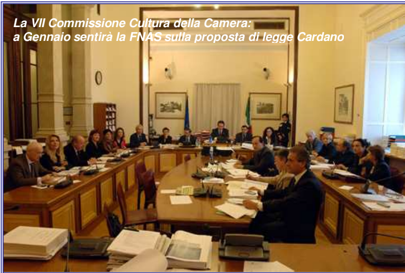
La VII Commissione Cultura della Camera: a Gennaio sentirà la FNAS sulla proposta di legge Cardano

KASO è anagramma di KAOS. La relatà è figlia del KAOS ed è madre del KASO. Gigi aveva appena messo giù il telefono e mi aveva guardato sconcertato: “lo e te rimaniamo a Roma fino a domani!”. Io ho annuito col capo e contemporaneamente ho risposto “IMPOSSIBILE!”