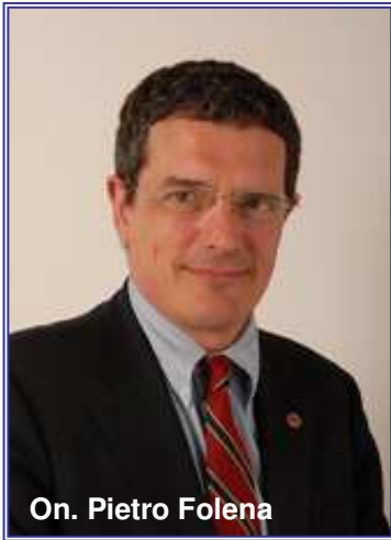
On. Pietro Folena

Le poltrone del salottino inglese del presidente, sono accoglienti e la vista sui tetti di Roma, dal suo ufficio, è davvero spettacolare. Gigi attacca subito e dopo i doverosi ringraziamenti, fa doverose premesse, pone doverose domande. La prima sorpresa è nel vedere che questo presidente, alle 17 PM, cioè allo sfiorir della giornata parlamentare è ancora sufficientemente lucido per ascoltare le nostre considerazioni. Un presidente di commissione che sa ascoltare è già qualcosa.